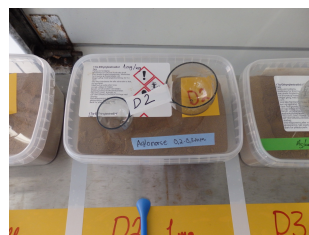
Laboratoriearbeid og forskning i praksis