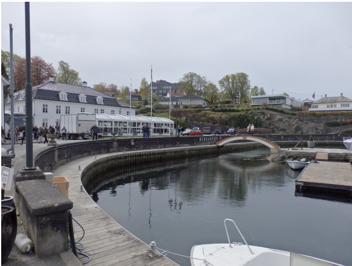
Bekkjarvik viste seg fra sin vakreste side under årets vårtur.

Tirsdag 12. mai dro nærmere 100 medlemmer fra Senioruniversitetet i Åsane på en minnerik og innholdsrik vårtur til Austevoll.