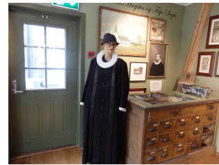
Historiske miljøer og kulturminner i Bekkjarvik