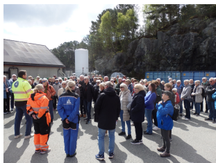
Omvisning ved Havforskningsstasjonen

Tidlig om morgenen kl 0900 møtte deltakerne opp ved Åsane Terminal før bussene satte kursen mot Krokeide. Etter fergeturen til Hufthamar fortsatte reisen gjennom Austevolls vakre øyrike med holmer, sjøhus, små bygdesamfunn og moderne havbruksanlegg. Langs veien kunne deltakerne oppleve hvordan havet fortsatt setter sitt preg på både næringsliv, kultur og hverdagsliv i øysamfunnet. Den klare vårdagen og det flotte været gjorde turen ekstra stemningsfull.