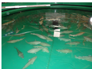
Forskningskar med fisk brukt i studier av vekst og miljø

Ved Havforskningsstasjonen på Sauganeset fikk deltakerne en grundig og inspirerende innføring i arbeidet som utføres innen havbruk, fiskevelferd, marin forskning og bærekraftig matproduksjon. Forskerne fortalte hvordan moderne teknologi brukes for å forstå hele livssyklusen til fisken – fra de minste larvene til voksen fisk i store forskningskar. Gruppen fikk se laboratorier, tekniske installasjoner, forskningskar og ulike marine organismer som brukes i forskningen. Det ble forklart hvordan temperatur, lysforhold, vannkvalitet og ernæring påvirker fiskens utvikling og helse. Deltakerne fikk også høre om forskning som bidrar til å løse globale utfordringer knyttet til matforsyning, miljø og bærekraft. Besøket gjorde stort inntrykk og viste tydelig hvor langt fremme Havforskningsstasjonen i Austevoll ligger internasjonalt.