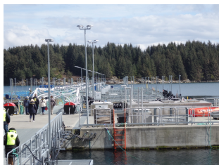
Moderne havbruksanlegg i Austevoll