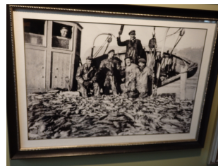
Historiske bilder fortalte om livet langs kysten