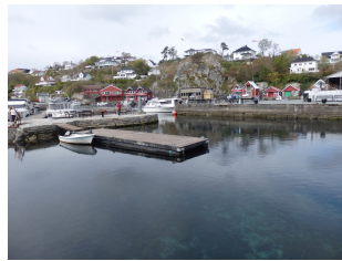
Bekkjarvik havn er fortsatt et levende kystmiljø